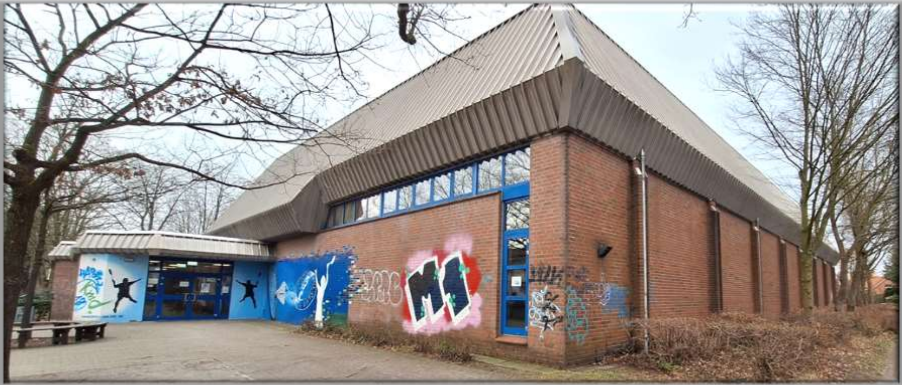
1. Hilfe, Lager (ehm. Hausm.)